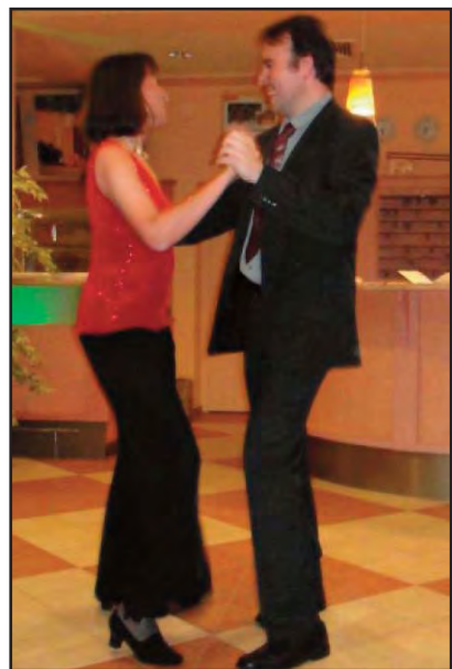
Dancemuloj dum la balo