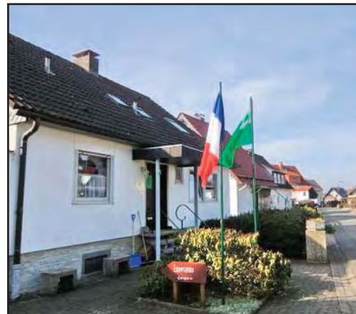
Interkultura Centro en Herzberg