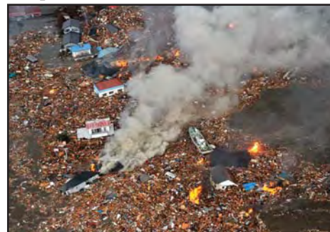
Post la cunamo

Post la tertremo kaj cunamo okazis la tria terura afero, la difekto de la nuklea centralo de Fukuŝima, kiu situas ĉe la maro. La funkcio de akvo-liverado por malvarmigi la nukleaĵon estis difektita, kaj devis evakui la loĝantojn ekster la radiuso de 30 kilometroj. La radiado de la nukleaj blokoj estas timiga ne nur por la japanoj, sed por la tuta mondo.