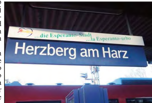
Ŝildo en la stacidomo Herzberg