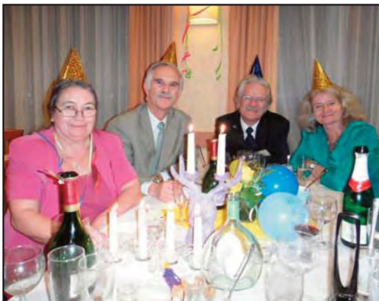
Dum la silvestra balo