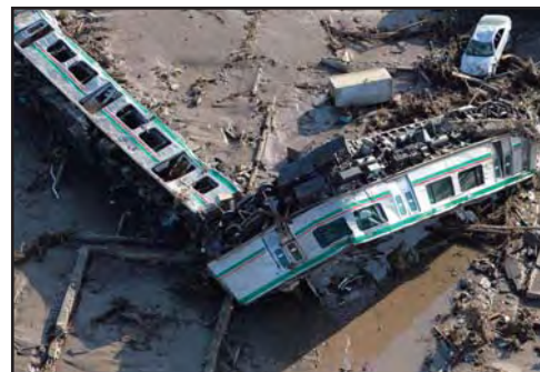
Disrompitaj vagonoj post la tertremo kaj cunamo

En la nordorienta parto de Japanio okazis terura tertremo la 11-an de marto 2011, kiu estis la plej granda en la historio de Japanio. La magnituda skalo montris 9,0, kiun sekvis granda cunamo, kiu forte penetris al la tero laŭ la bordo de la Pacifika Oceano, kaj kaŭzis ne priskribeblajn detruojn. En la tertremo kaj la cunamo ĝis nun mortis pli ol dekdu mil personoj kaj malaperis pli ol 15 mil homoj. Tio estas nekomprenebla. Kelkaj urbetoj tute malaperis de sur la tereno, ĉie videblas ruinoj, ruboj, nerekonseble disrompiĝintaj veturiloj, trajnoj, suferantaj kaj malesperaj homoj. Rigardante la riportojn, bildojn, filmojn pri la kataklismo, kunpremiĝas niaj koroj kaj ĉagrenas nin, eĉ la tutan mondon.