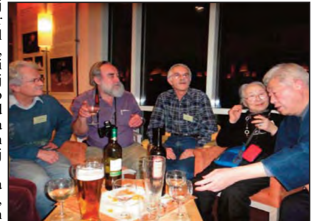
En amika rondo

Estis okazo promeni en la urbo, rondiri la urban muregon, viziti preĝejan turon kaj lokan muzeon. Plurfoje ni povis sekvi