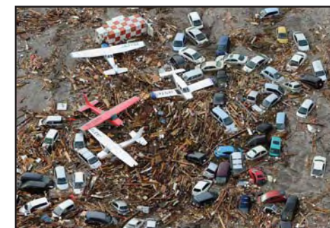
La detruoj de la cunamo

Nia Federacio havas landan asocion en Japanio. Ni ankoraŭ ne ricevis de la asocio iun sciigon pri la katastrofo, kaj ni esperas, ke niajn japanajn fervojistajn esperantistojn ne tuŝis rekte la tertremo kaj cunamo. Tamen ni esprimas niajn kunsentojn kaj maltrankvilojn, nian profundan funebnon por niaj japanaj gekolegoj, kaj konsolon al ĉiuj japanaj popolanoj. Ni esperas, ke baldaŭ ĉesos la danĝero kaj minaco, kaj komenciĝos la rekonstrua laboro.