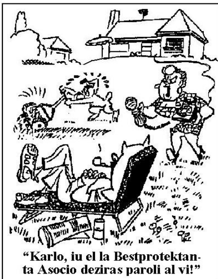
"Karlo, iu el la Bestprotektanta Asocio deziras paroli al vi!"