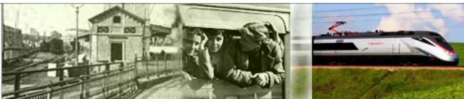
150-a jardatreveno de la ŝtato Italio: la fervojo multe helpis por ĝia unuiĝo.

A fanciulla oziosa il diavolo le balla in corpo. Al pigra knabino la diablo dancas en la korpo. (Venetio) □