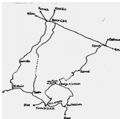
Fervojaj linioj trans la Apeninaj Montoj