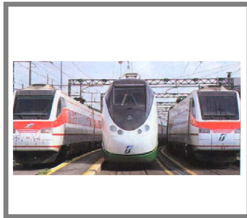
Italia "Floto" Eurostar: ETR 450, ETR 500, ETR 460/480.